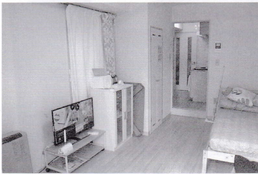
▼直営ハウス（しろくまハウス2号室）

付・助成金のご支援を賜り、皆様に大きな喜びを差し上げられるよう力を注いで参りたいと思っております。引き続き皆様のご理解とご支援をお願いいたします。