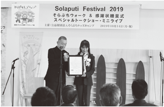
▲感謝状をいただき、記念撮影

医療施設を備え、特別に配慮された施設やプログラムで創る夢のキャンプ。病気の子どもたちやその家族が、自然の中で病気のことを忘れ、笑顔で楽しい時を過ごし、「楽しい思い出」「すばらしい仲間」「生きる力」「希望」を得ることが出来る場所を提供しています。