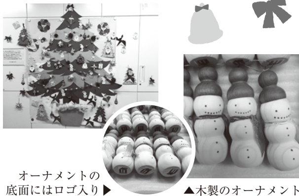
オーナメントの 底面にはロゴ入り▶

二〇一九年十二月六日に、毎年開かれる北 大病院クリスマス会で、今年も木を使い手作 りしたオーナメントをプレゼントしました。 子どもたちは毎年楽しみにしてくれていて、 今年も大いに盛り上がりました。